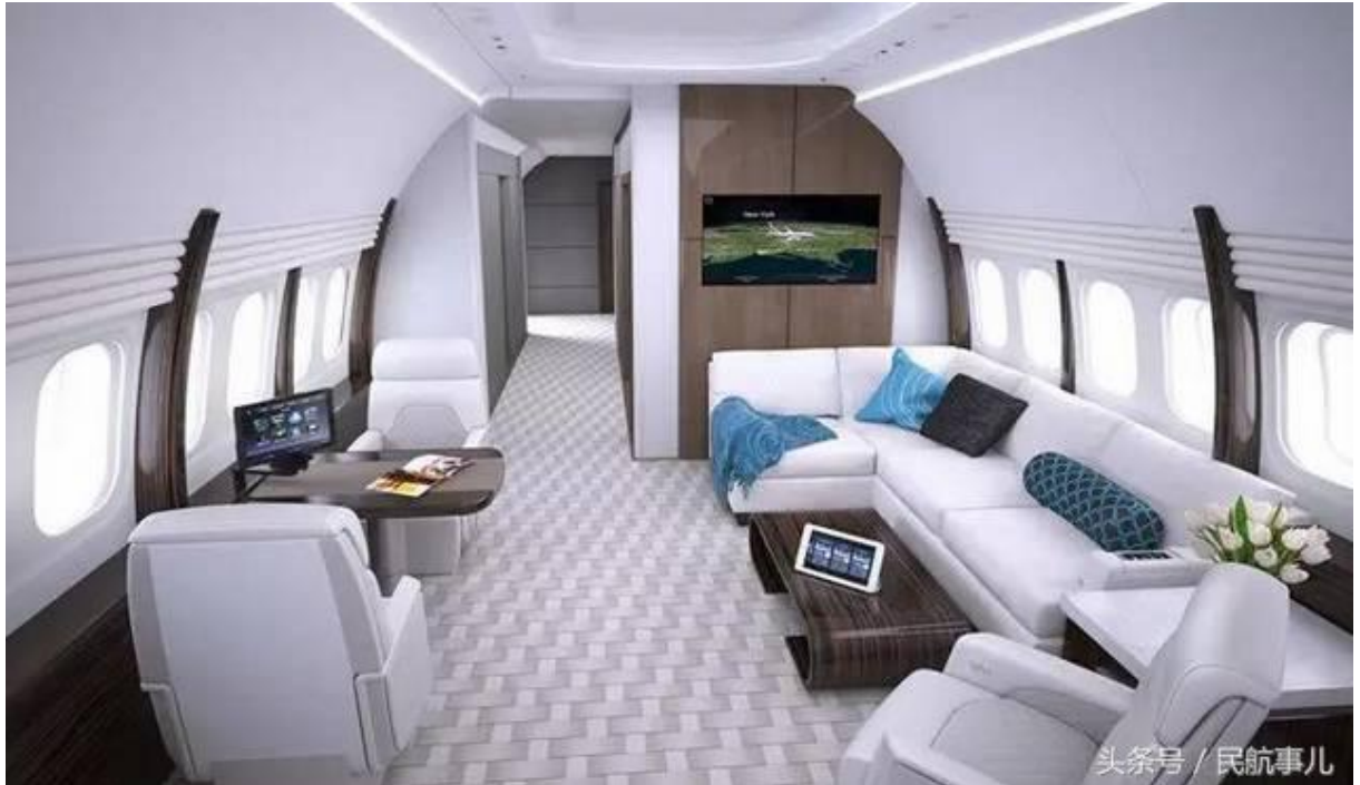
空客ACJ320neo公务机豪华客舱